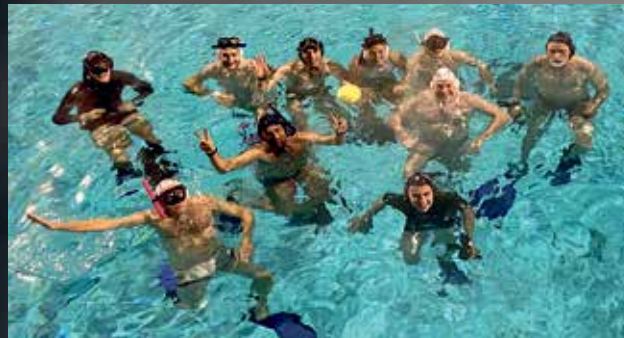
UWR Training im Sprungbecken