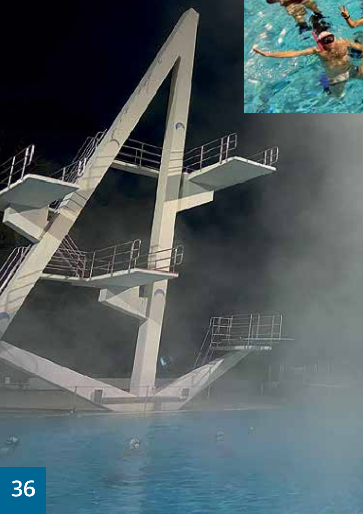
Winter-Freibadtraining für Unerschrockene

Wir warten sehnsüchtig auf die Eröffnung des Hallenbads.